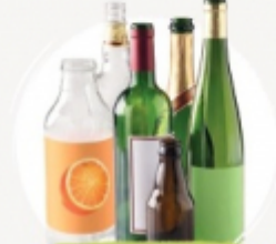
BOUTELLES EN VERRE