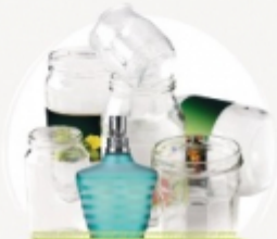
POTS, BOCAUX ET FLACONS EN VERRE