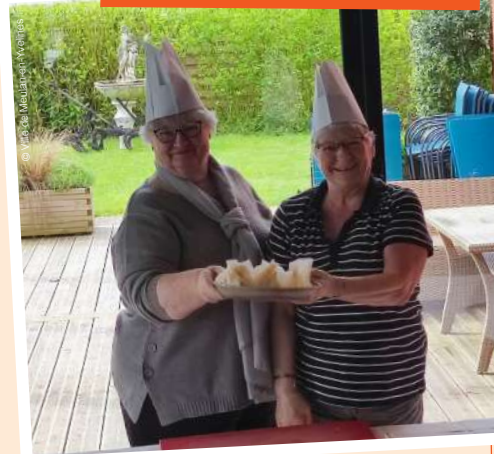
Bateaux parisiens • 30.05.23