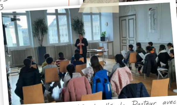
Rencontre des CM2 de l'école Pasteur avec Cécile Zammit-Popescu, le Maire, le 7 avril. Ils ont eu l'opportunité de visiter la Mairie et d'échanger avec le premier magistrat de la commune lors d'une journée riche en découvertes.