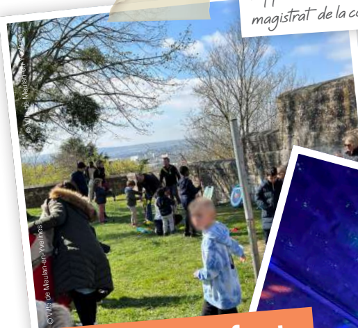
Chasse aux œufs et soirée Ados • 8 avril