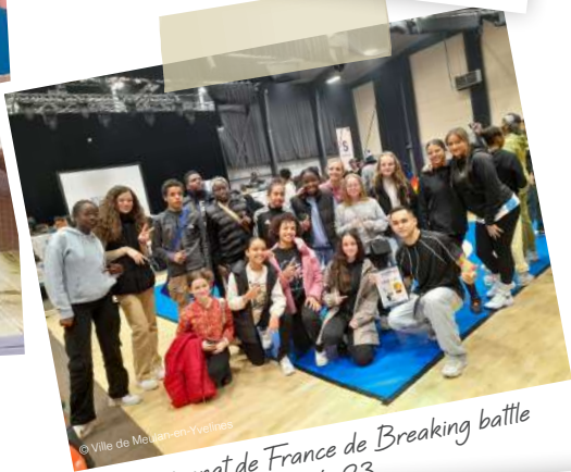
Championnat de France de Breaking battle 03.04.23