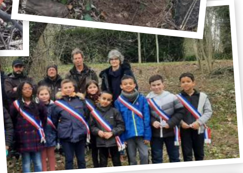
Comémoration • 08.05.23